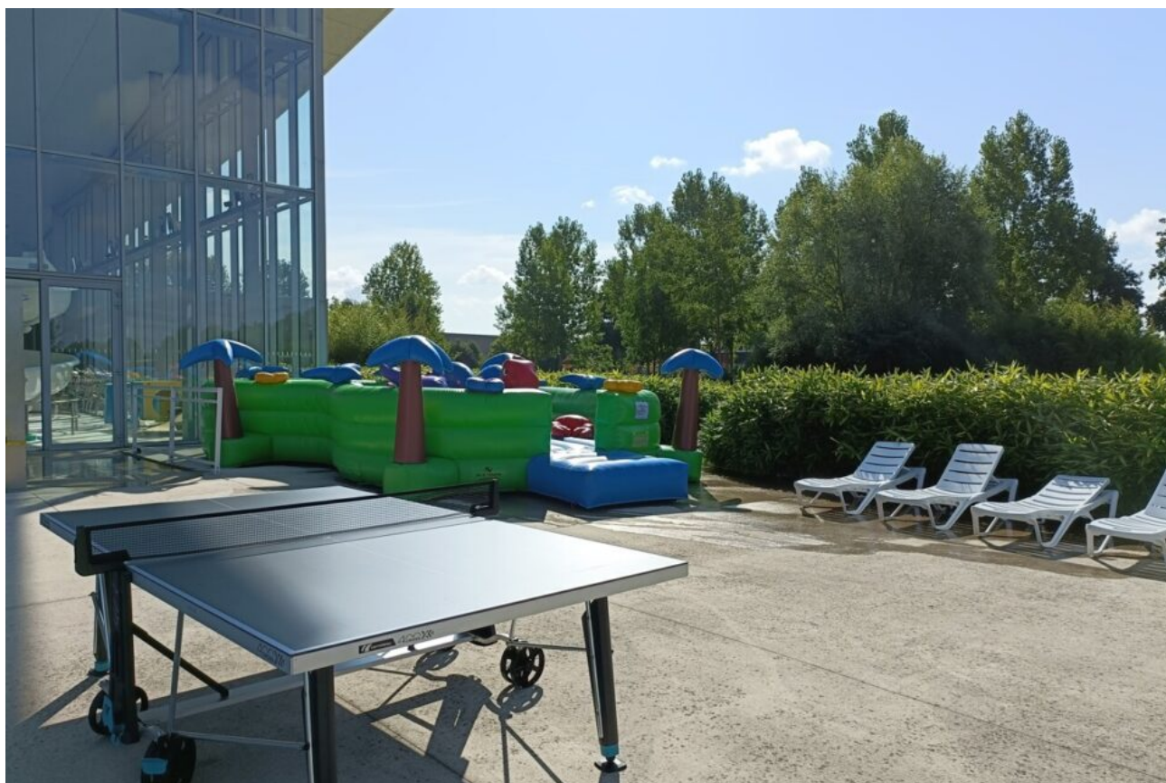
Le centre aquatique de Val d'Europe à Bailly-Romainvilliers a mis en place de nouvelles structures pour cet été 2023.

Jets d'eau, hammam, spa... le centre aquatique de val d'Europe est bien équipé. Mais pour cet été 2023, le lieu, installé à Bailly-Romainvilliers a ajouté de nouveaux équipements.